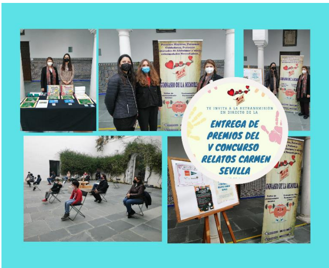
V CONCURSO (2020-2021)