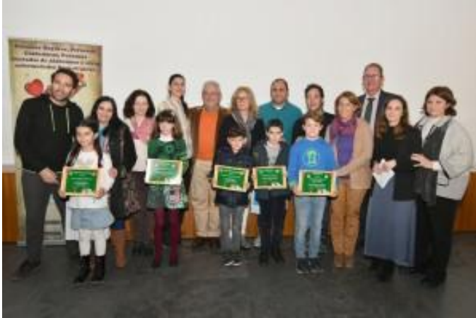
IV CONCURSO (2019-2020)

CIF: G-91.998.005 Nº de Registro de Asociaciones: 14536 Nº de Registro de Voluntariado: 2436 Centro Sanitario NICA 49430 Club de la 3ª Edad y Pensionistas "El Conde" – Plaza de la Constitución S/N 41940 Tomares (Sevilla) Tlf: 607902800/ 673443732 Email: afa.tomares@gmail.com Web: http://afatomares.es