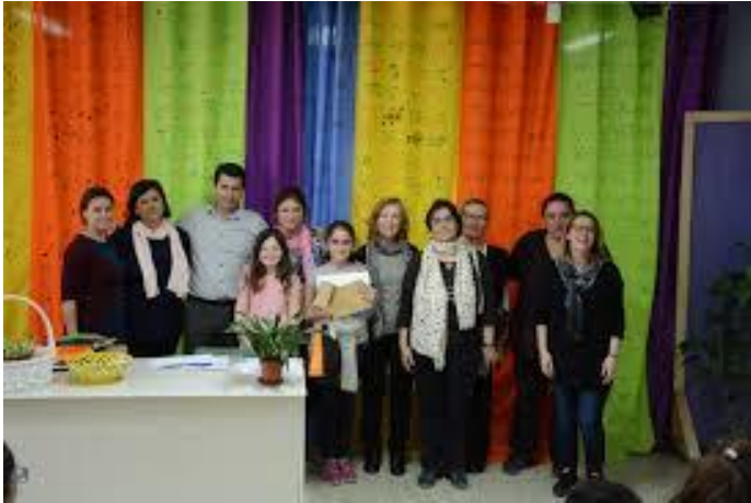
I CONCURSO (2016-2017)