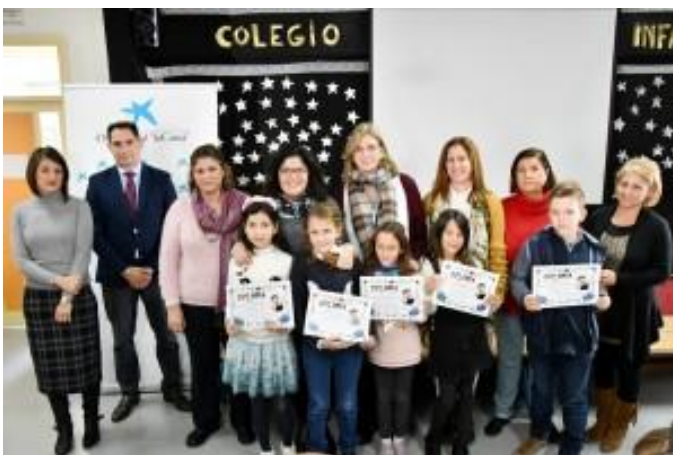
III CONCURSO (2018-2019)