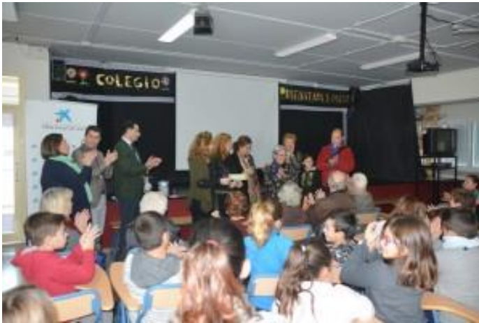
II CONCURSO (2017-2018)